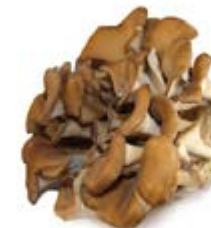
Maitake Grifola frondosa