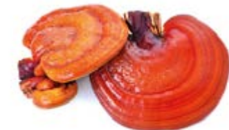
Reishi Ganoderma lucidum