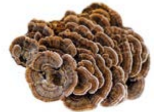
Trametes Trametes versicolor